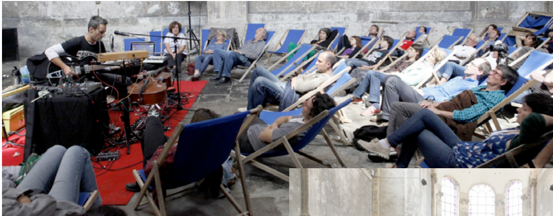
PUBLIC EN CHAISES LONGUES FOURNIES PAR VOS SOINS